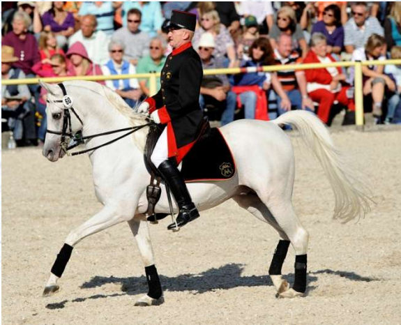
Halbschabracke in kleiner Größe

Grundsätzlich stehen drei Arten der Schmuckschabracken zur Auswahl: Halbschabracken, die nur den sichtbaren Teil hinter dem Sattel schmücken, sowie Vollschabracken ohne und mit Sattelüberzug. Aufwand und Preis steigen in dieser Reihenfolge, wobei jede Schabracke anhand ihrer Maße und dem damit verbundenen Materialverbrauch individuell kalkuliert wird. Wir fertigen jederzeit auch Einzelstücke und gewähren bereits ab zwei identischen Schmuckschabracken einen Staffelpromiss.